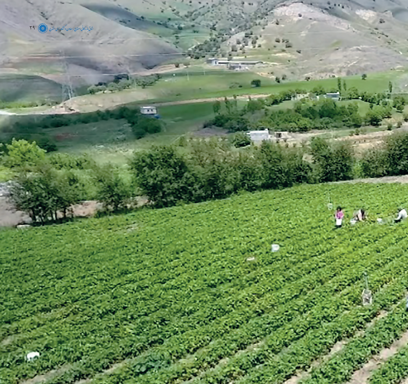
مزارع توت فرنگی